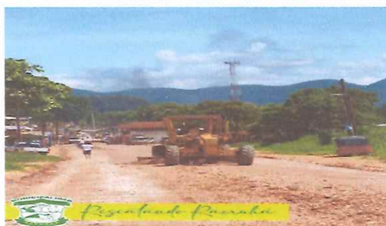
Rescatando Raxruhá Xkolb'al Raxruhá